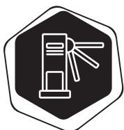
ZASTREŠENIE A ROZŠÍRENIE TURNIKETOV

Zabezpečenie vonkajšieho sedenia s prestrešením pre všetky technológie (nefajčiarska a fajčiarska zóna) za účelom zvýšenia miery komfortu pracovného prostredia zamestnancov.