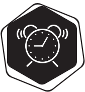
OHLASOVANIE ZAČIATKU A KONCA PRESTÁVKY

Moderné odbory týmto Programovým vyhlásením žiadajú vedenie JLR o výmenu súčasného pracovného oblečenia za kvalitnejšie s prevládajúcim obsahom bavlny.