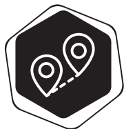
CESTA DO PRÁCE

Na požiadavke veterných štítov z predchádzajúceho Programového vyhlásenia stále trváme. Preto považujeme za nevyhnutné dohliadnuť na práve prebiehajúcu výstavbu veterných štítov.